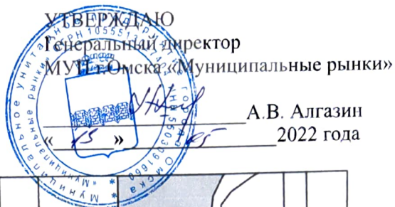
Схема размещения торговых мест на ярмарке ГРЯ-26 по ул. 50 лет Октября, 98 действует с 30.05.2022